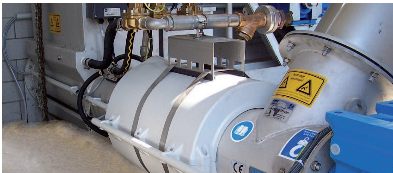
Kompakte Bauweise des HUBER Rechengutverdichters Ro7 – auch mit Rechengutauswaschung