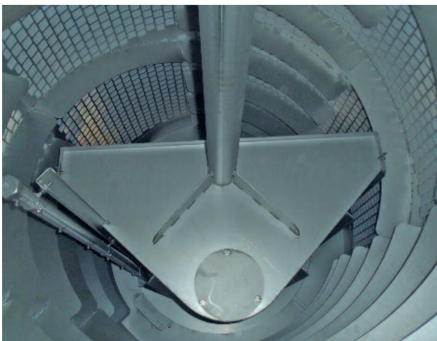
Abscheidung feinsten partikulärer Stoffe durch den HUBER Trommelsieb RoMesh®

Beispiele für die vielfältigen Anwendungsfälle in der Industrie sind: