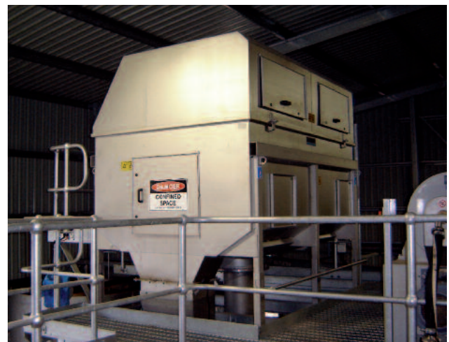
HUBER Trommelsieb RoMesh® im Einsatz zur Abwasserbehandlung in der Industrie