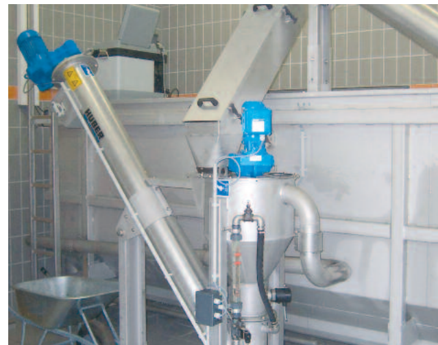
Kleine HUBER Sandwaschanlage RoSF4 TC wäscht klassierten Sand aus einer HUBER Kompaktanlage ROTAMAT® Ro5