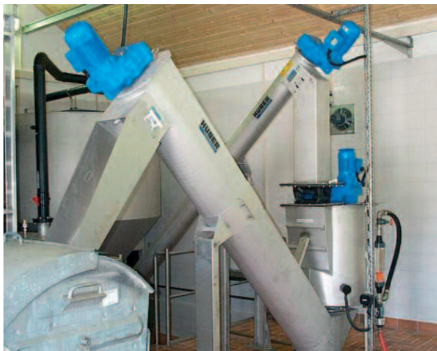
Die HUBER Sandwaschanlage RoSF4 T wäscht klassierten Sand aus einem HUBER Rundsandfang HRSF

Die organischen Bestandteile werden automatisch mit dem eingebrachten Waschwasser aus der Anlage geschwemmt.