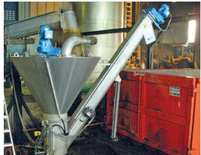
Spezielle Ausführung geeignet für die Behandlung von Sedimenten aus Biogasanlagen