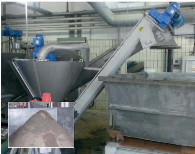
Einsatz der Sandwaschanlage auf einer kommunalen Kläranlage