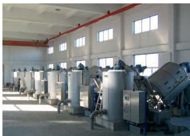
Осем машини за сгъстяването на 600 м 3 /ч