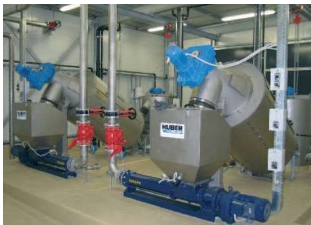
Два HUBER Шнекови сгъстителя S-DRUM за 80 м 3 /ч

По света успешно работят над 700 HUBER Шнекови сгъстителя.