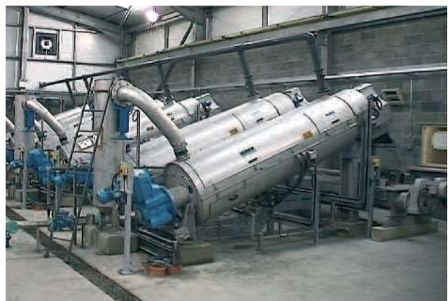
Шест паралелни HUBER Шнекови преси S-PRESS