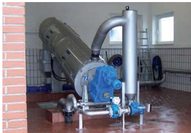
HUBER Шнекова преса S-PRESS за 8 м 3 /ч