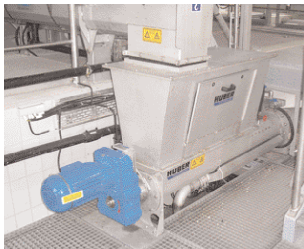
Сигурно третиране на отсятата маса с WAP