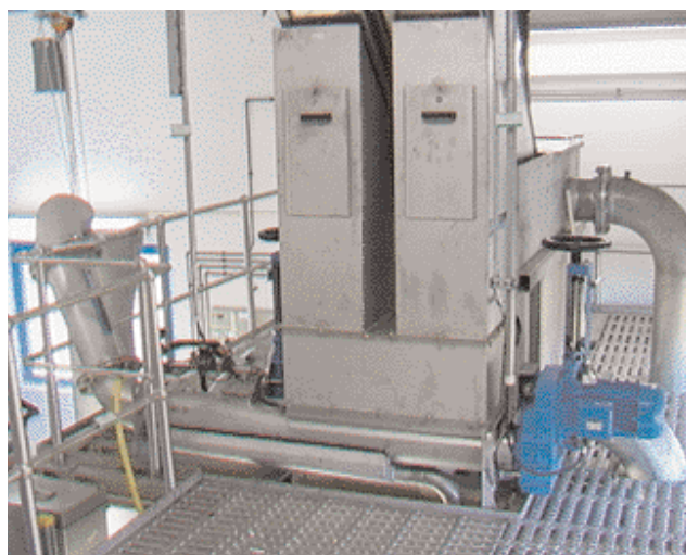
Възможна е всякаква ситуация на храняване

След промиването пречистената отсята маса се придвижва в затворен вертикален щранг по-нататък към зоната на пресоване. Там промитият материал посредством пресоващия шнек се обезводнява до едно СВ-съдържание от 35 - 45 %. Отделяната от отсятата маса, богата на въглерод промивна вода сеотвежда в канала. Събирателната вана под машината може автоматично да се почиства с вода. Промитата и компактирана отсята маса накрая се транспортира през конична изнасяща тръба в контейнер.