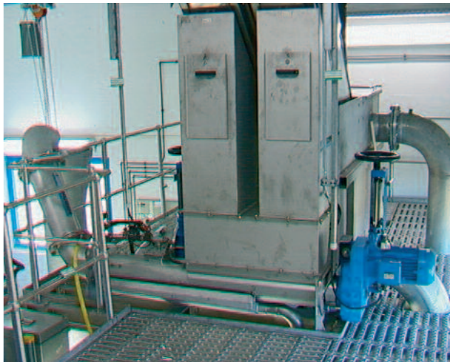
Jede Einwurfsituation ist möglich

Nach der Wäsche wird das gewaschene Rechengut im geschlossenen Steigrohr weiter zur Presszone gefördert. Dort wird das gewaschene Material mittels der Pressschnecke auf einen TS-Gehalt von 35 - 45 % entwässert. Das aus dem Rechengut entweichende, kohlenstoffreiche Waschwasser wird in das Gerinne abgeleitet. Die Auffangwanne unterhalb der Maschine kann automatisch mit Wasser gereinigt werden. Das gewaschene und kompaktierte Rechengut wird letztendlich über ein konisches Austragsrohr in den Container gefördert.