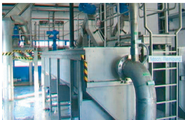
Oberirdische, redundante HUBER Langsandfänge ROTAMAT® Ro6