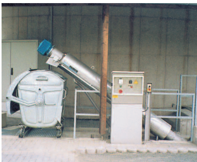
HUBER Siebschnecke ROTAMAT® Ro9 in Freiluftaufstellung