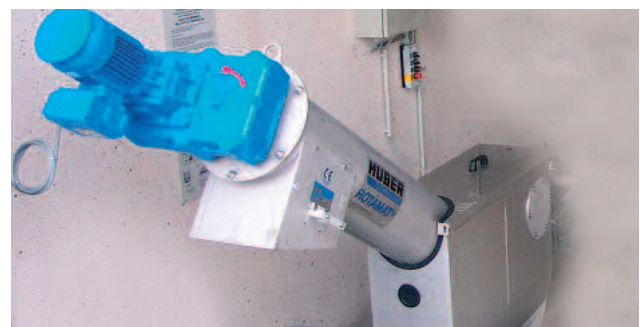
HUBER Siebschnecke ROTAMAT® EC im Behälter