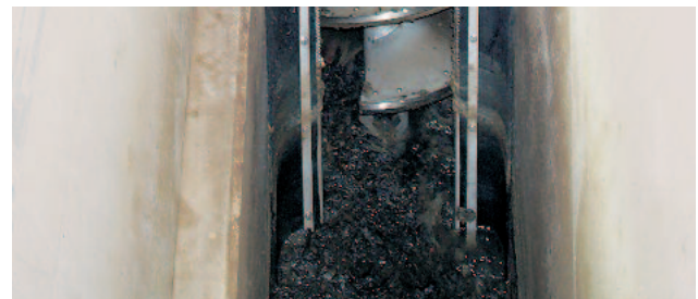
HUBER Siebschnecke ROTAMAT® Ro9 XL mit unterer wartungsfreier Keramiklagerung