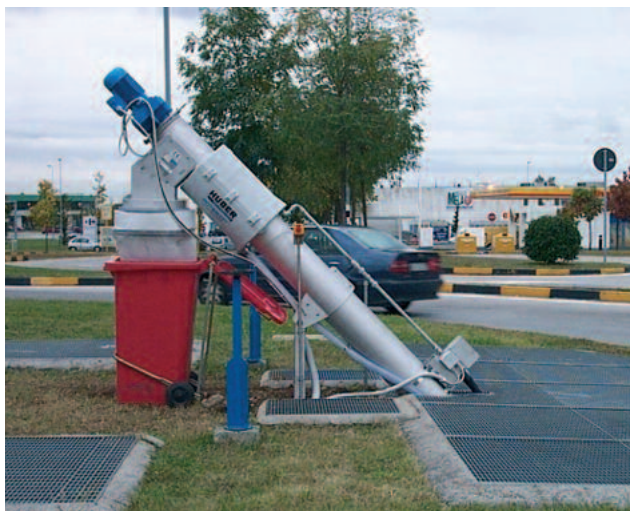
HUBER Siebschnecke ROTAMAT® Ro9 inmitten eines Kreisverkehrs