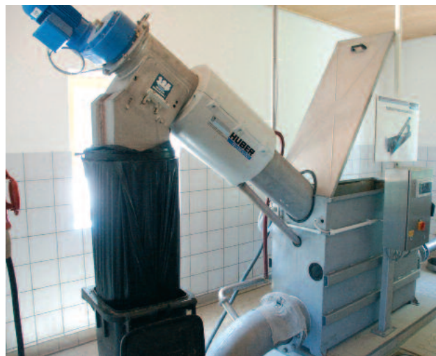
Behälterausführung der HUBER Siebschnecke ROTAMAT® Ro9