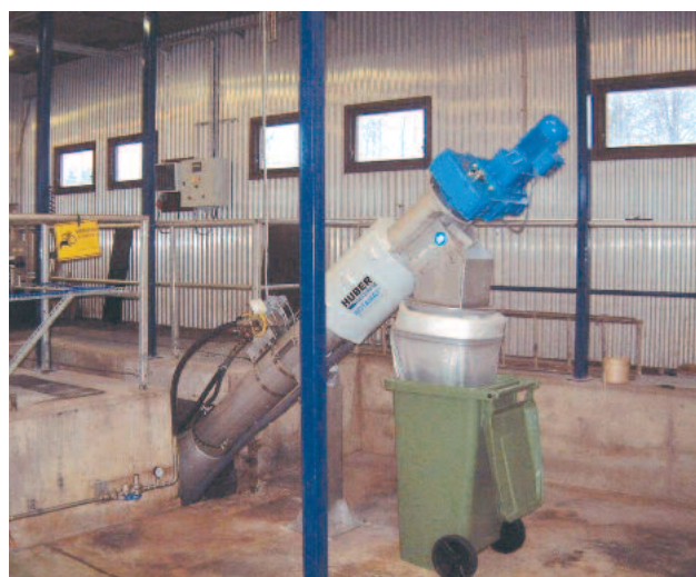
Gerinneeinbau der HUBER Siebschnecke ROTAMAT® Ro9 – Baugröße 700