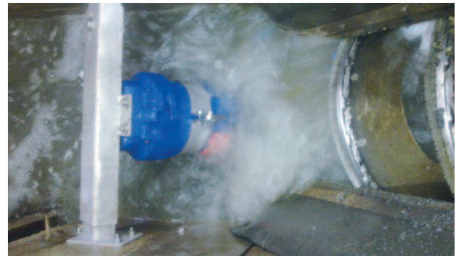
Bei der externen Rechengutauswaschung (ERGA) werden die organischen Bestandteile über eine vorgeschaltete Auswaschvorrichtung gelöst und ausgewaschen.