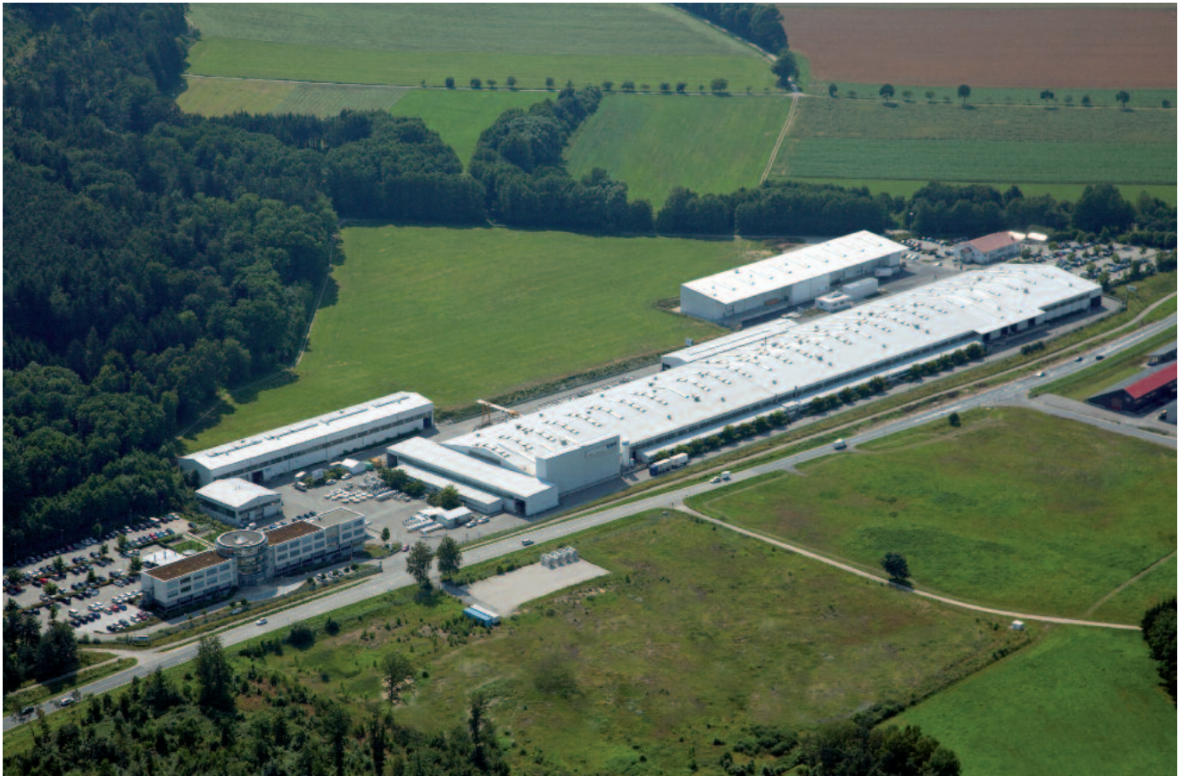
HUBER Firmensitz und Produktionsstätte in Berching / Bayern